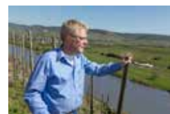
Weingut Fritz Haag Mosel, Brauneberg www.weingut-fritz-haag.de