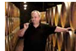
Weingut DR. Heger Baden Ithringen www.heger-weine.de