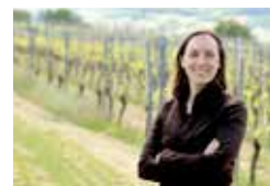
Weingut Simone Adams Rheinhessen, Ingelheim www.adamswein.de