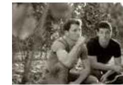
Weingut Reibold Pfalz, Freinsheim www.weingutreibold.de