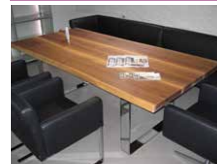
Tisch Natura 220 x 100 cm Nussbaum massiv mit Waldkante geölt, Gestell Chrom glänzend, 4.283 €