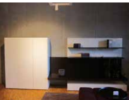
Anbaukombination Regolo Lack weiß matt und glänzend, Eiche dunkel 2.356 €