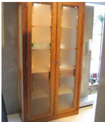
Fugatum Geschirrschrank 2-türig Amerikanischer Kirschbaum natur geölt, satiniertes Glas mit Facette, B. 104, H. 205, T. 43 cm 5.816 €