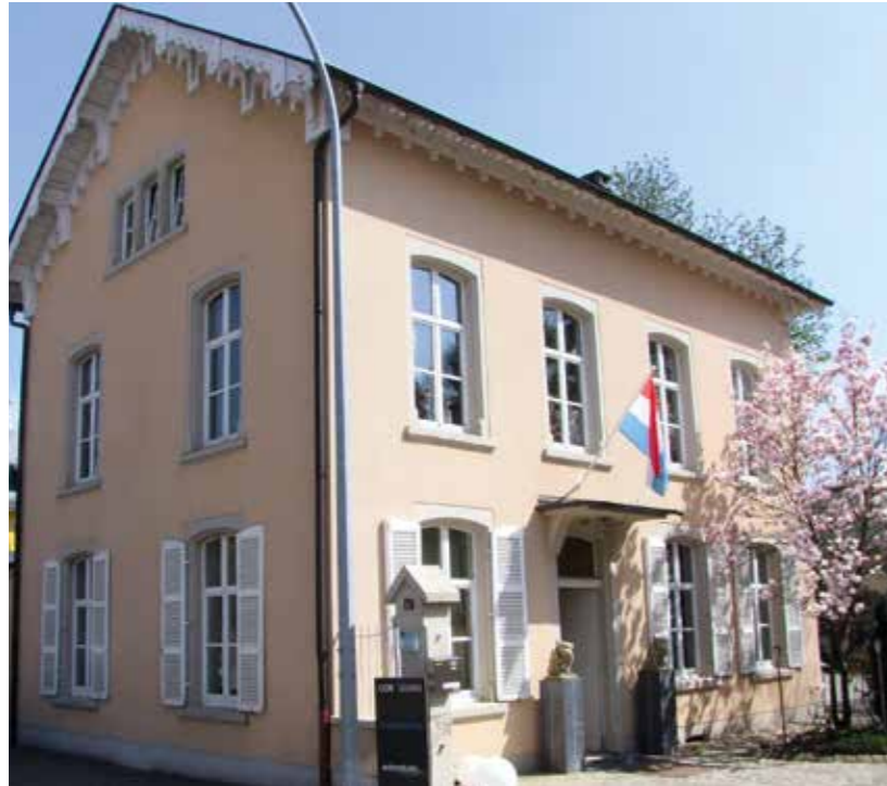
Unser Wohnstudio in der Alten Stadtvilla in Grevenmacher