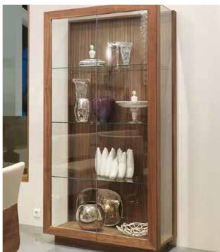
Vitrine Ego Nussbaum geölt, B 100 x H 195 x T 44,4 cm 3.925 €