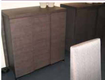
Kommode Max Eiche grau, Gestell bronzefarbig B: 96, T: 47, H: 101,5 cm 2.905 €