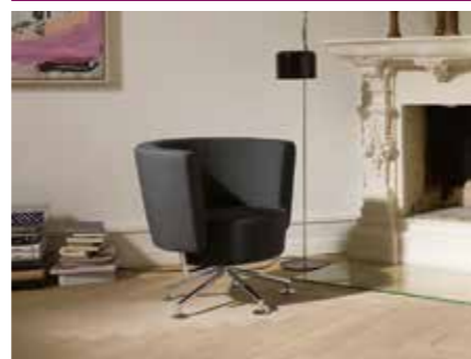
Drehsessel Circo Stoff grau, Füße nickelfarbig 2.164 €