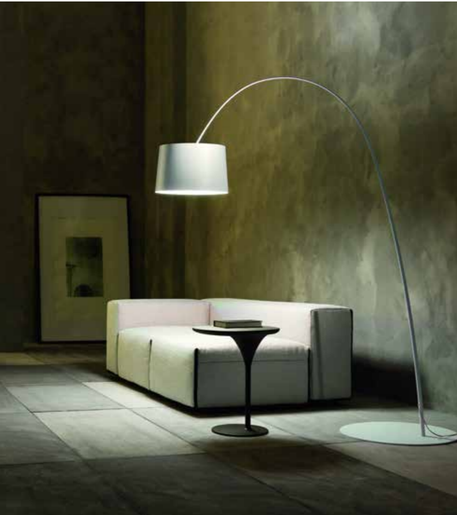
Licht mit Anlauf, das sich schwungvoll und in großem Bogen ergießt. Ein wunderbarer Gedanke.