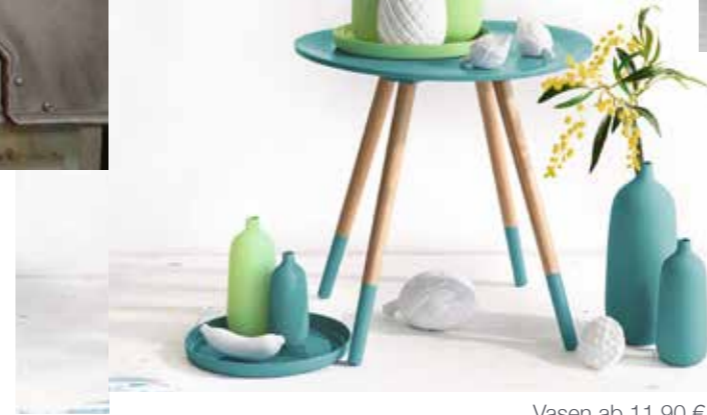
Vasen ab 11,90 €

Schön und praktisch. Also praktisch richtig schön. Ein wahrer Prack-Tisch. Die passenden Vasen und ein wenig Obst hat er gleich mitgebracht. Wie praktisch! Artischoccke mini, je 4,90 € Ananas, je 29,90 € Banane, je 6,90 €