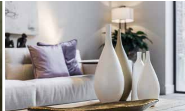
Hier sitzt der Bauch mal an der richtigen Stelle und zeigt, dass er auch ganz schön edel und attraktiv daherkommen kann.