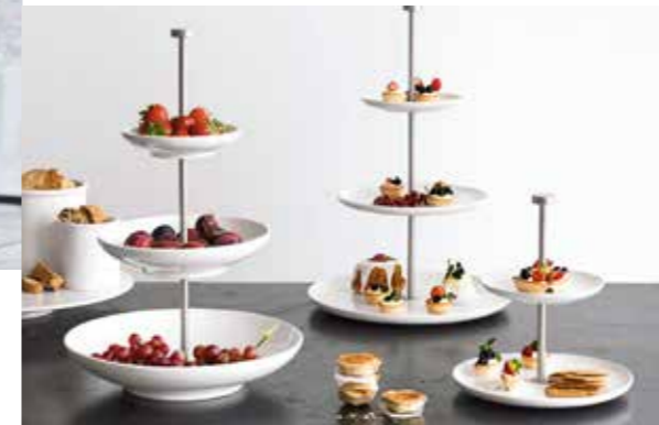
Wie gut, dass sie einfach nicht totzukriegen sind – die Etageren aus Omas Zeiten. In neuem trendigen Design: ein Hochgenuss! ab 29,90 €