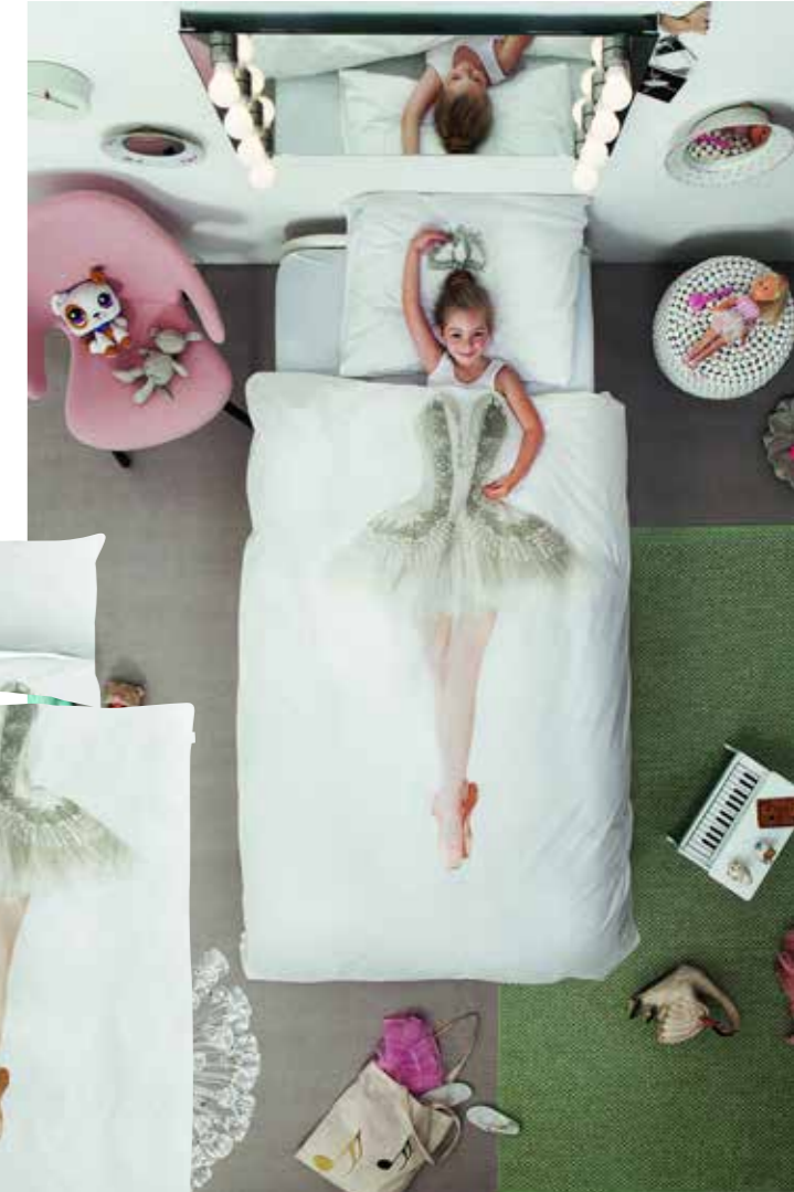
Der Traum jedes kleinen Mädchens: Ballerina über Nacht. Endlich! Kissen 80 x 80 cm, Bezug 135 x 200 cm; auch in anderen Größen/Motiven erhältlich 59,95 €