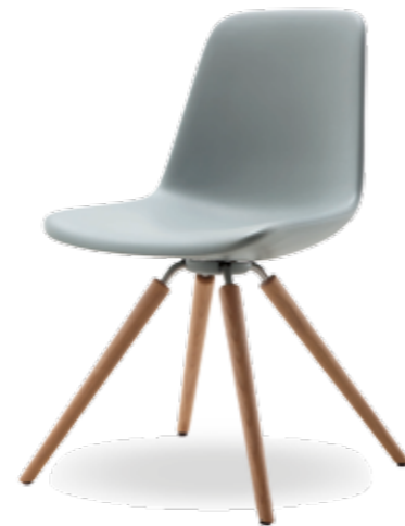
Vierbeiniges Sitzobjekt, anschniegssam, mit guter Figur, sucht ebensolchen Besitzer; verschiedene Untergestelle ab 355,- €