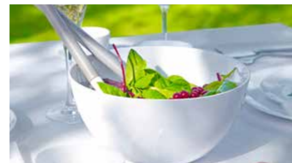
Ein edler Begleiter bei Tisch. Diese Salatschüssel hat sich für ihren Auftritt ganz fein gemacht. 23,90 €