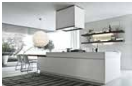
Freuen Sie sich auf noch mehr Hubor & Hubor: Am Sa., 26. und So., 27.10. 2013 stehen die Designtage ins Haus.