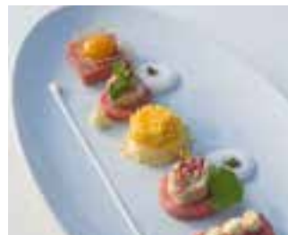
Steinheuers Restaurant Zur Alten Post Landskroner Straße 110 53474 Heppingen-Bad-Neuenahr-Ahrweiler 0049 (0) 2641 / 94860

Weingut Künstler Gault Millau Eichelmann