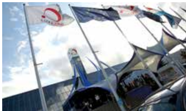
Auch dieses Jahr zeigen wir auf der Luxexpo wieder einmal, was wir können.