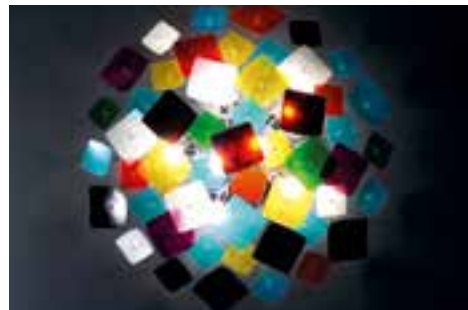
Lichtgestalten! Entdecken und staunen. Tag und Nacht der Lichter: am 9. November 2013. Bei uns.

Ruwerer Straße 21b • 54292 Trier Tel.: +49 (0) 651 / 2008-300 • Fax: +49 (0) 651 / 2008-322 E-Mail: automobile-trier@heister-gruppe.de • Web: www.heister-gruppe.de