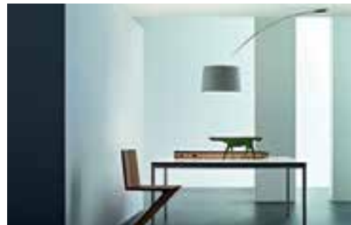
Charakter! Wie Möbel einen Raum prägen – lassen Sie sich bei einem Besuch im Hause Hubor & Hubor faszinieren.