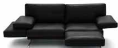
Ausziehen und einklappen: Polstermöbel mit Funktion.