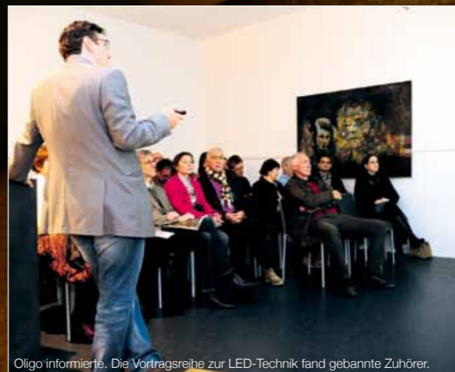
Oligo informiert. Die Vortragsreihe zur LED-Technik fand gebannte Zuhörer.