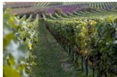
Guter Wein – gutes Gespräch!