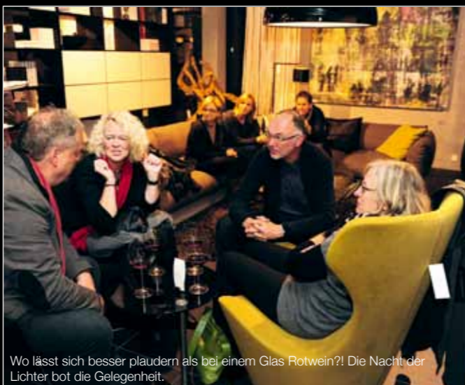
Wo lässt sich besser plaudern als bei einem Glas Rotwein?! Die Nacht der Lichter bot die Gelegenheit.