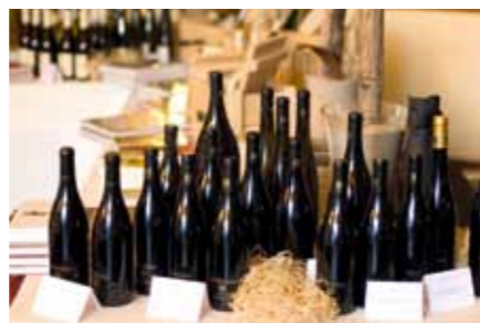
Mehr Platz für edle Tropfen im Hubor Weinkontor.