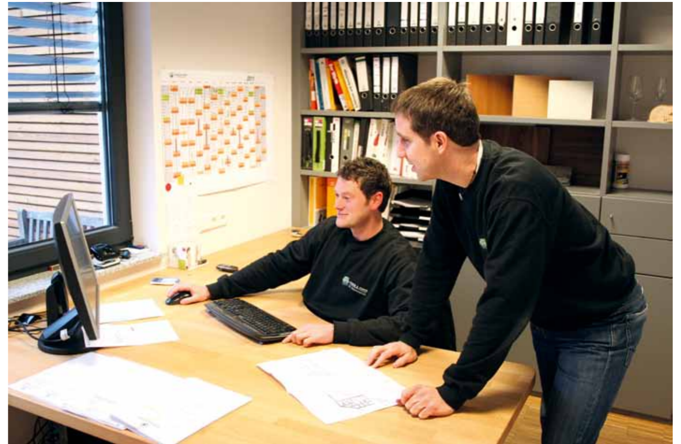
Teamarbeit bei der Planung einer neuen und individuellen Einrichtung