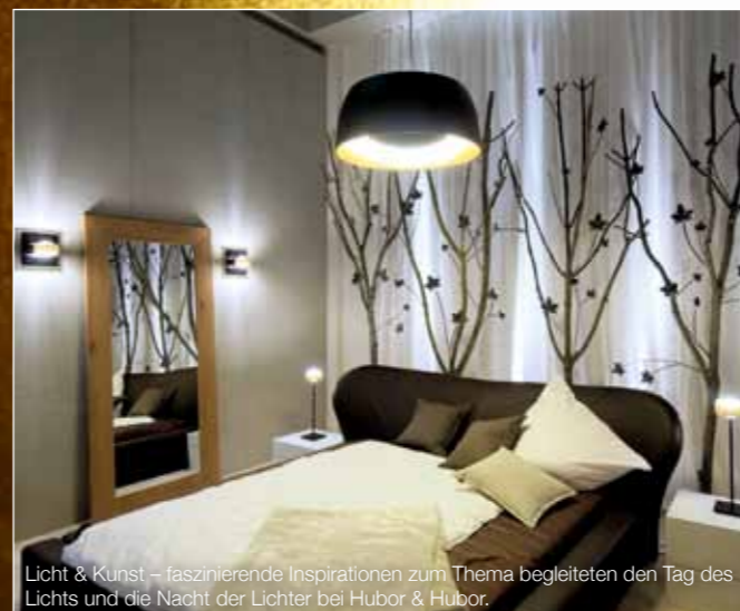
Licht & Kunst – faszinierende Inspirationen zum Thema begleiteten den Tag des Lichts und die Nacht der Lichter bei Hubor & Hubor.