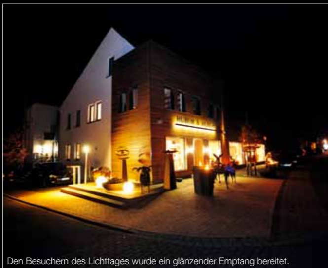
Den Besuchern des Lichttages wurde ein glänzender Empfang bereitet.

PS: Lichtideen halten wir das ganze Jahr für Sie bereit. Bringen Sie uns ein Bild Ihrer Einrichtungssituation und ein paar Raummaße mit. Gemeinsam können wir dann schauen, wie und mit welchen Leuchtobjekten Ihre Räumlichkeit gestaltet werden kann.