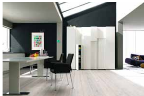
Neue Ideen im Wohnstudio in Grevenmacher. Unsere Stadtvilla wird umgestaltet.