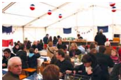
Frühlingsfest am Samstag, 31. März und Sonntag, 1. April 2012. Freuen Sie sich. Bald ist es wieder soweit.

Die hubor14 wird Sie frühlingsfrisch in die neue Jahreszeit begleiten. prickelnd: unser Frühlingsfest: Wir freuen uns jetzt schon drauf. erfrischend: wohnen mit interlübke belebend: Unsere Polstermöbel zeigen, wie Technik und Funktionalität sich auf den Nenner Schönheit bringen lassen. erquickend: Unser Weinkontor ist endlich umgebaut. Viel Raum für große Weine.